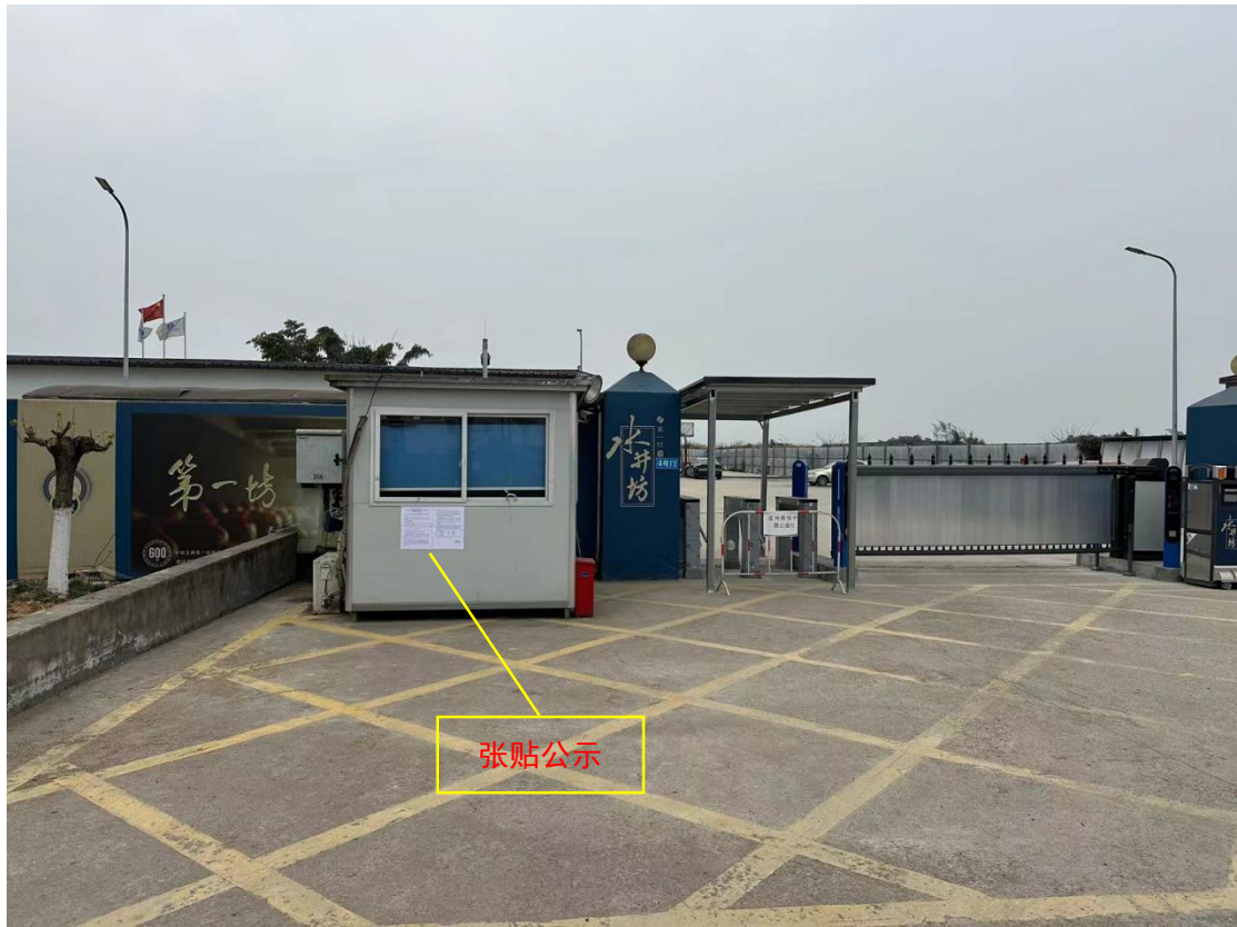
图 3-4 项目所在地张贴公示