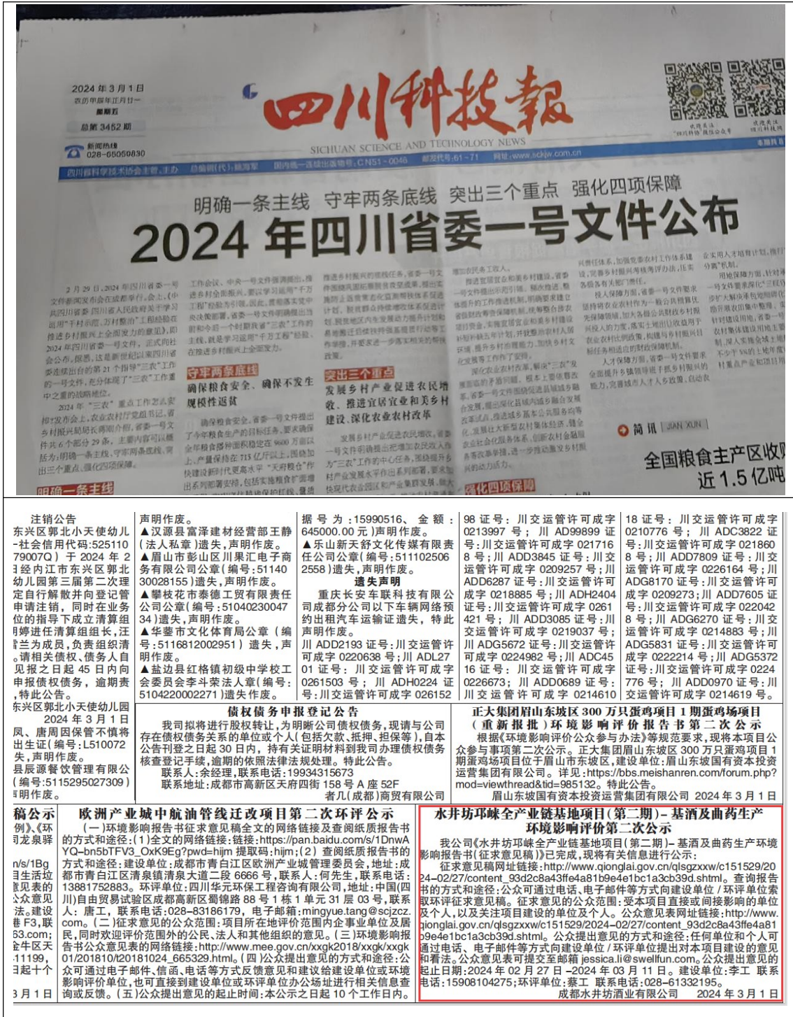
图 3-2 2024 年 03 月 01 日四川科技报公示内容

根据《环境影响评价公众参与办法》（生态环境部令第4号）要求，本项目在网络公示期间，于2024年03月01日和2024年03月06日先后两次将公示内容刊登在《四川科技报》进行公示，公示内容见图3-2至图3-3。