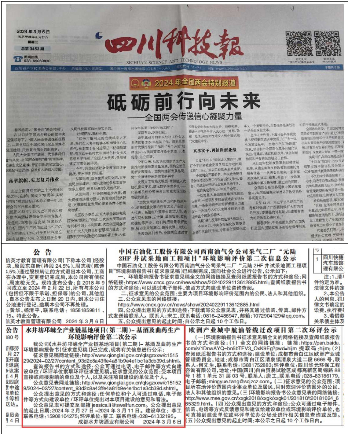
图 3-3 2024 年 03 月 06 日四川科技报公示内容