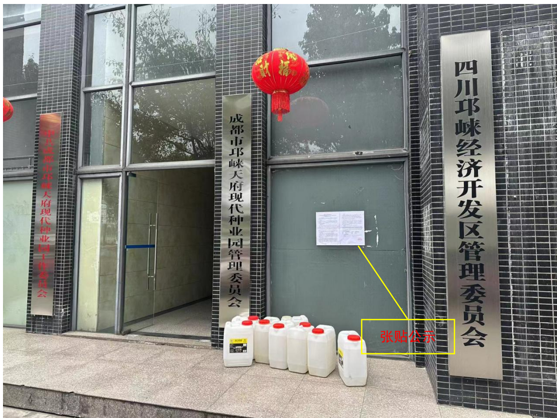
图 3-5 园区管委会所在地张贴公示